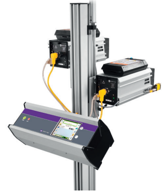
Compacte controller biedt kleinere footprint zonder umbilicals