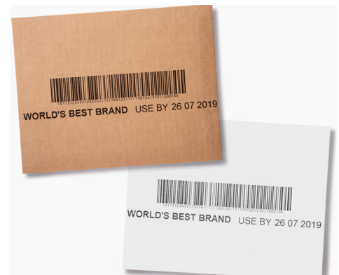
Verlaag uw totale eigendomskosten, TCO, terwijl u conforme GS1-128-barcode verkrijgt