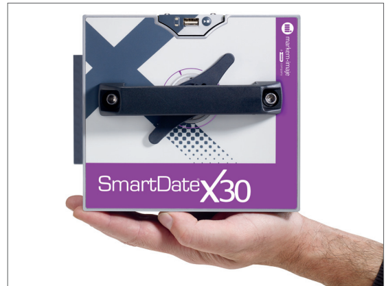
外型小巧紧凑，便于集成。SmartDate X30 是最小的 SmartDate 打码机。