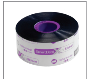
三大系列色带和丰富的配件可选，供您根据包装类型和需求进行选择。