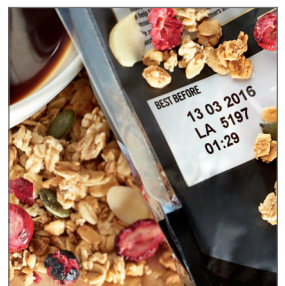
世界领先的服务，保证高效稳定的生产和高质量的产品标识。