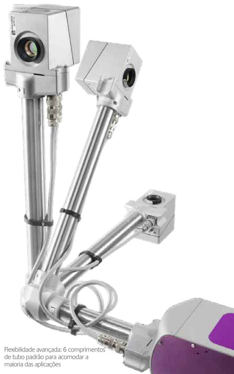
Flexibilidade avançada: 6 comprimentos de tubo padrão para acomodar a maioria das aplicações

Tenha a segurança de que a BOU foi projetada para manter os rigorosos padrões de segurança da MI, e adicioná-la ao sistema de marcação não comprometerá a proteção IP55 de fábrica.