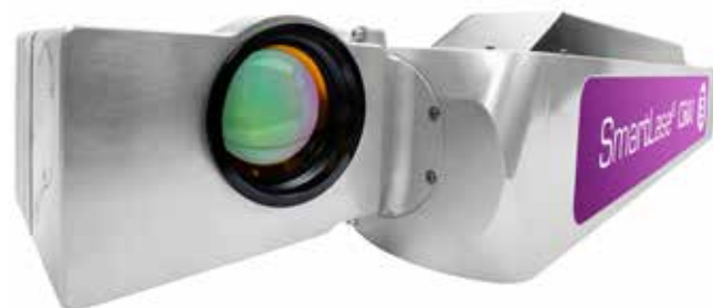
配上 X-WIDE 大面积打印头, 您可以用更少的打印机做更多的事情!